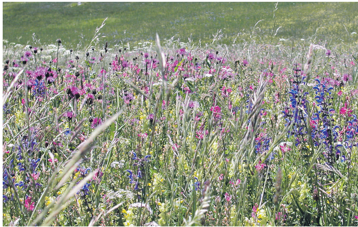
Wer die Wiesenmeisterschaften gewinnen will, muss mit grosser Artenvielfalt auftrumpfen.

Natürlich haben die Wiesen auch landwirtschaftlichen Wert. Der Heuertrag der extensiven und wenig intensiven Wiesen dürfte rund 3800 Tonnen Heu betragen. Geht man davon aus, dass eine Kuh pro Tag rund 16 Kilogramm Heu frisst, könnten vom Ertrag